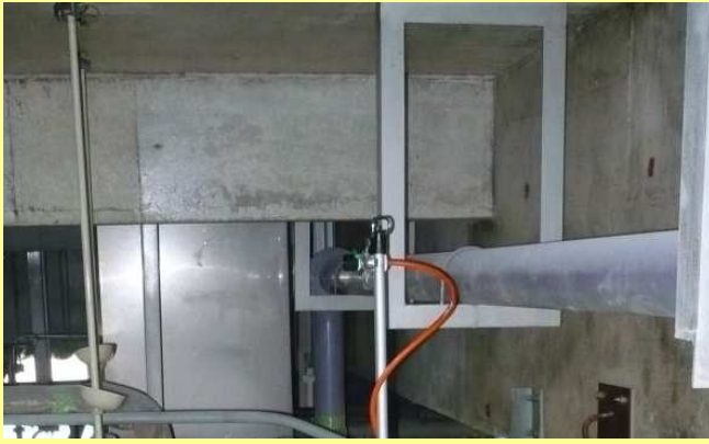
アスキヤッチ CC 塗布 (透明仕上げ)