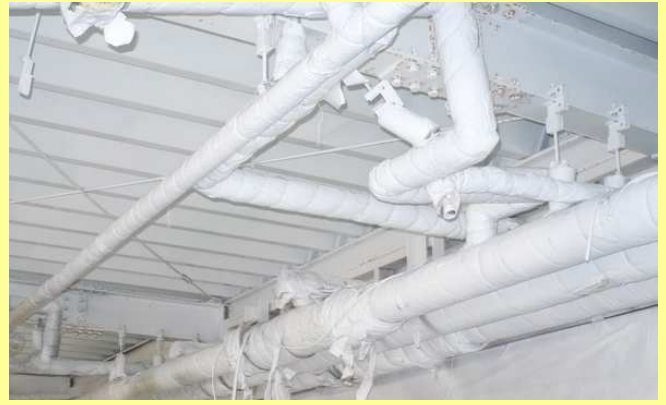
アスキヤッチ CW 塗布 (白色仕上げ)