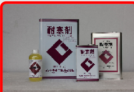
CIC耐寒剤(塩カルタイプ) 18kg・4.5kg・1.8kg・500ml 低温時のコンクリート・モルタルの凍結防止用、 セメントの硬化促進用