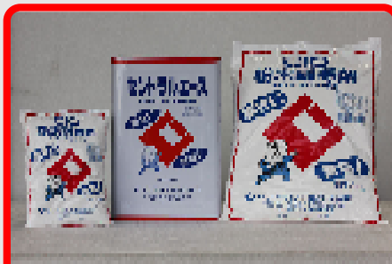
セントラルエース(無塩) 18kg CIC粉末耐寒剤(無塩) 9kg・1.2kg 低温時のコンクリート・モルタルの凍結防止用、 セメントの硬化促進用