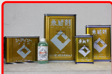
CIC急結剤 18kg・9kg・4.5kg・1.8kg・500ml セメントの急速硬化用