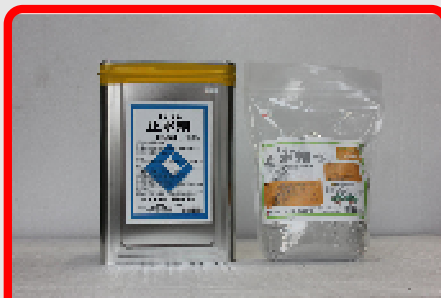
CIC止水剤 20kg・4kg 接着性瞬結止水セメント