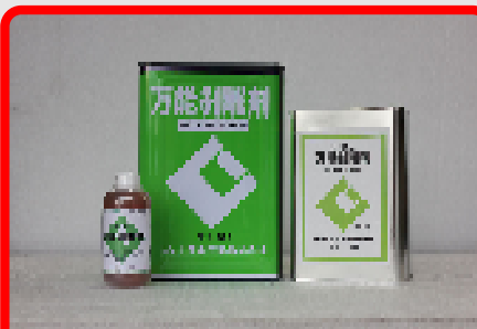
CIC万能剥離剤 18L・4.5L・500ml 金枠・木枠両用(原液使用)