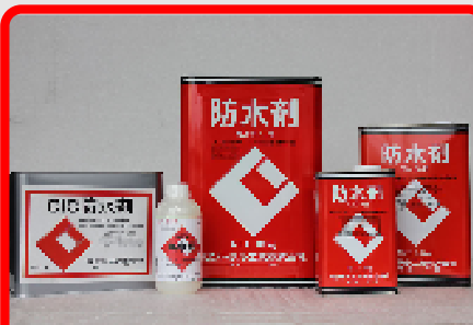
CIC防水剤 18kg・9kg・4.5kg・1.8kg・500ml モルタルの防水・防湿用