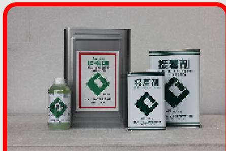
CIC接着剤(セメントノロタイプ) 18kg・4.5kg・1.8kg・500ml モルタル・コンクリート密着用