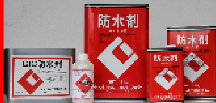
CIC防水剤 18kg・9kg・4.5kg・1.8kg・500ml モルタルの防水・防湿用