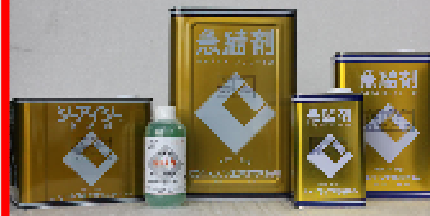
CIC急結剤 18kg・9kg・4.5kg・1.8kg・500ml セメントの急速硬化用